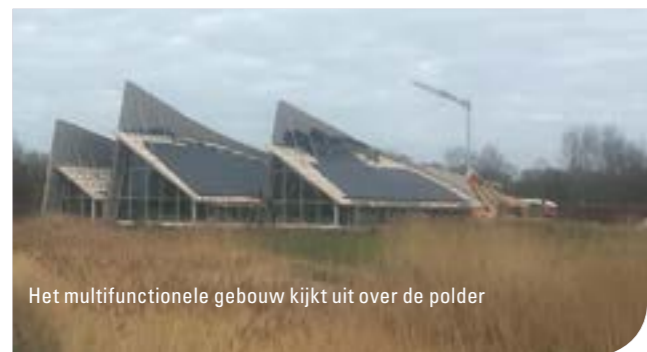
Het multifunctionele gebouw kijkt uit over de polder

In het prachtig vormgegeven gebouw kan PC Uitvaart, samen met Monuta, een volledige uitvaart verzorgen op één locatie. En wat voor locatie: het pand staat op een unieke plek met uitzicht over het polderlandschap van het Egmondermeer. Op dit moment wordt hard gewerkt aan het finetunen van de inrichting, die uiteraard net zo modern en stijlvol wordt als de buitenkant van het gebouw.